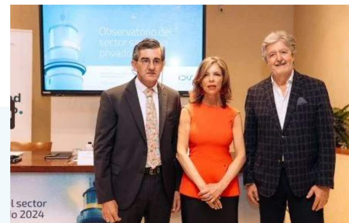
Ruedas de prensa