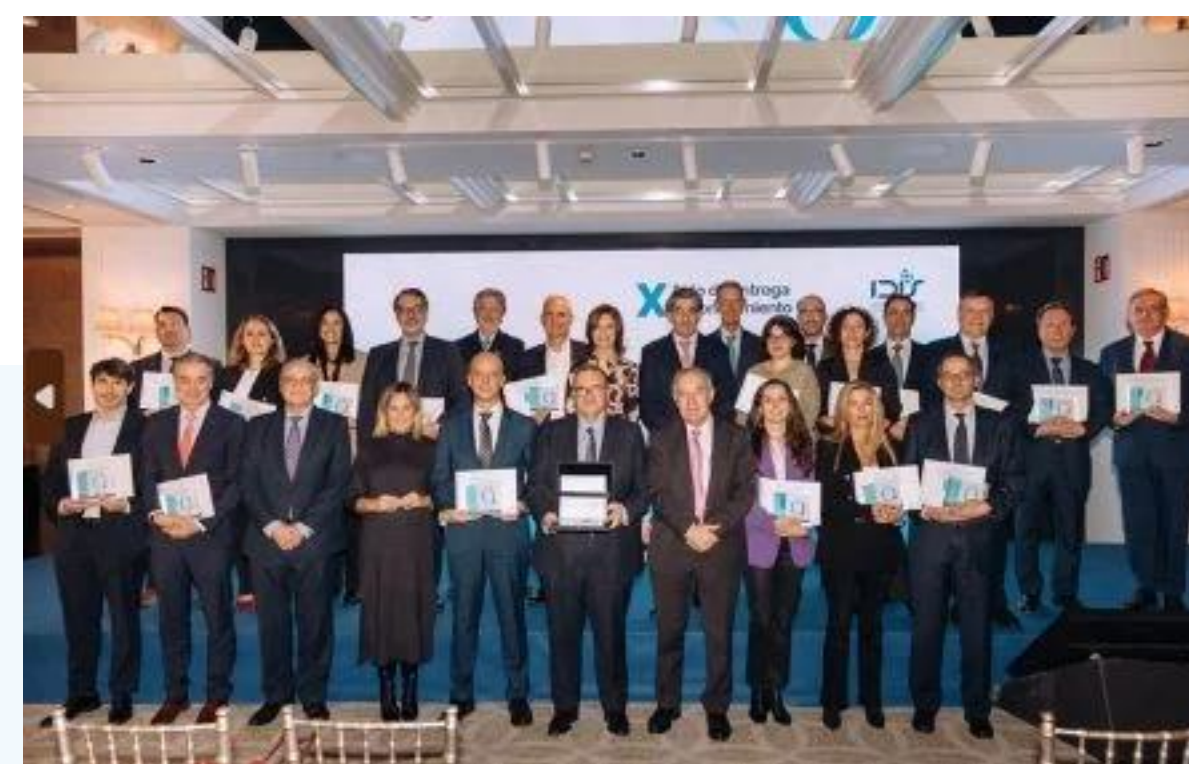
Entrega Reconocimiento QH