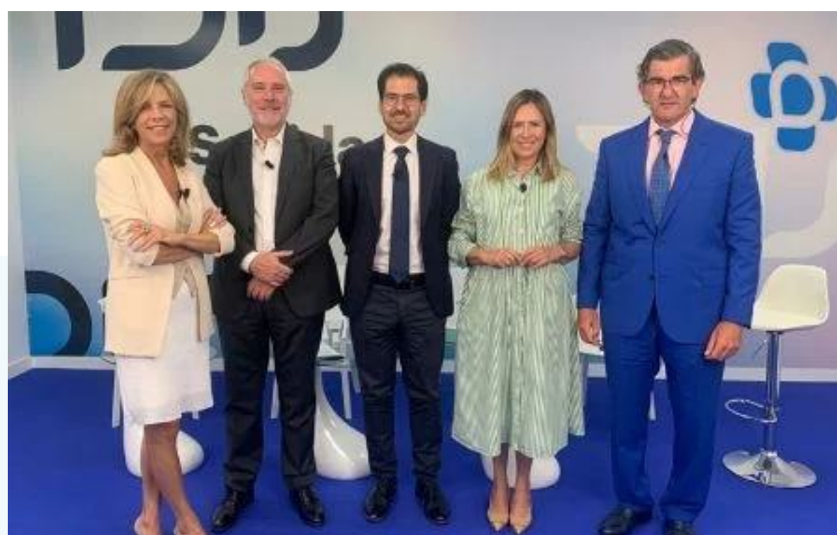
IDialogoS, ¿y ahora qué?